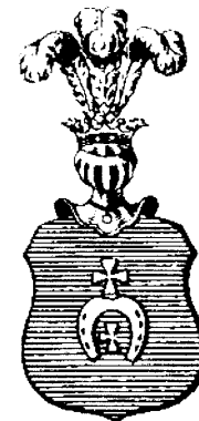
ABRAMOWICZ, cz. Lubicz odm.