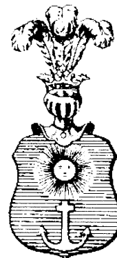
ABRAHAMOWICZ, cz. Kotwica odm.