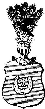
ABRAHAMOWICZ, cz. Jastrzębiec odm.